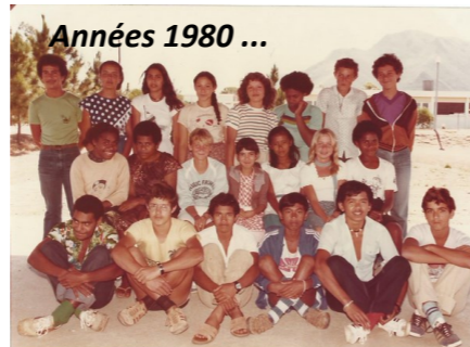
Années 1980 ...