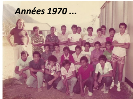
Années 1970 ...

Les collégiens ne « descendent » vers l'actuel bâtiment B qu'en 1992, avant, c'était une école primaire !