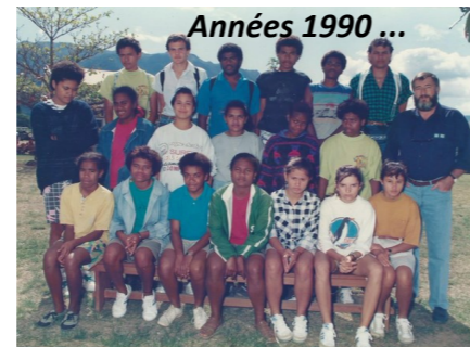
Années 1990 ...