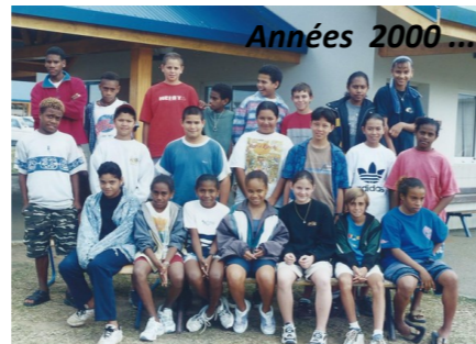
Années 2000 ...